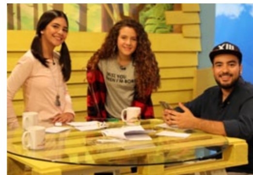
Juontajat vastaavat katsojien puheluihin ja lukevat heidän viestejään suorassa lähetyksessä.