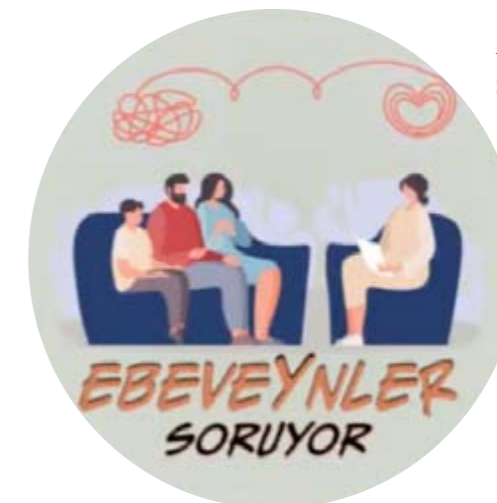
Alla: Şemsa ja Kanivar juontavat ohjelmaa nimeltä Perheyhteys .