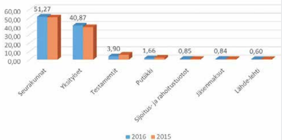
Tulolähteiden %-osuudet 2016 ja 2015

Suurimmat tuotot vuonna 2016: seurakuntien talousarvioavustukset 51,3 %, yksityiset suorat lahjoitukset 40,9 %, testamentit 3,9 %, Putiikki 1,7 %, sijoitus- ja rahoitustuotot 0,8 %, jäsenmaksut 0,8 % ja Lähde-lehti 0,6 %.