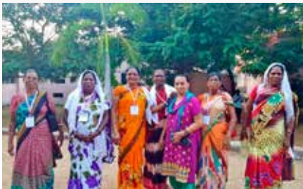
TWR-Intian järjestämään Toivoa naisille -konferenssiin osallistui viime syksynä yli 600 naista ja miestä Intian eri kielialueilta.

– Naisleskien asema Intiassa on todella huono. Heitä ei kunnioiteta ja he jäävät yksin. Jo pelkästään hengissä pysyminen yhteisön keskellä leskenä on hankalaa. Joulun aikaan jaamme heille joululahjoja. Jaamme noin 200 leskelle ruokatarvikkeita, yhden sari-kankaan kullekin ja muistikortilla olevia Toivoa naisille -radio-ohjelmia. Jos leskellä ei ole soitinta, millä kuunnella, annamme sellaisenkin. Jotkut lahjan saajista ovat kristittyjä, toiset eivät, kertoo TWR-Intian aluekoordinaattori.