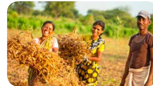
Intiassa, pääosin maaseudulla Biharin, Jharkhandin ja Gujaratin osavaltioissa, Sansa on tukenut vähemmistökielillä radioituja lyhyt- ja keskiäntolähetysjä jo yli kolme vuosikymmentä.

Sansa on vuodesta 2019 kustantanut TWR:n arabiankielisel Toivoa naisille -työlle työntekijän, joka vastaa sosiaalisen median kautta tullessiin yhteydenottoihin. Lähi-idän alueella naisen elämä saattaa olla ulkoisesti vaurasta, mutta yllätyksellisen keskellä he elävät vankeina omista kodeistaan ja ovat ahdistuneita ja masentuneita. Toivoa naisille -työn sosiaalisen median kautta he kuulevat rakastavasta Jumalasta. ■